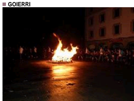
San Joan sua